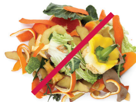
Desechos de jardín y comida