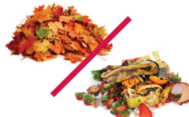
Desechos del jardín y alimentos