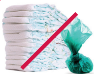
Pañales y excremento de mascotas