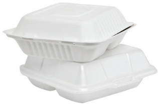
Espuma de poliestireno