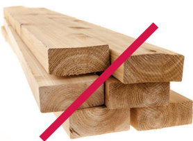
Residuos de la construcción