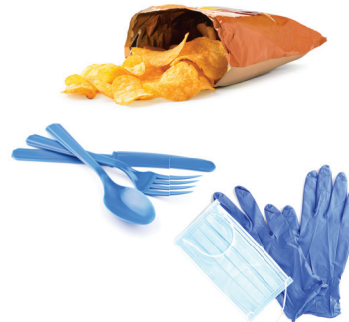
Plásticos no reciclables