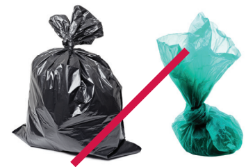
Basura y excremento de mascotas