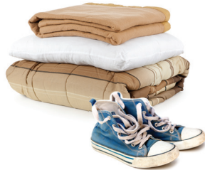
Ropa y ropa de cama