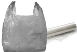
Bolsas y envolturas de plástico