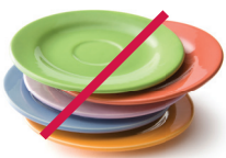
Platos y espejos