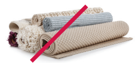
Alfombras y tapetes