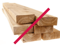
Residuos de la construcción