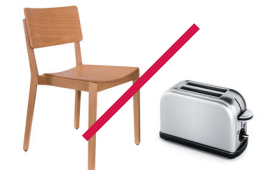
Muebles y electrodomésticos