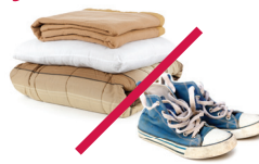
Ropa y ropa de cama