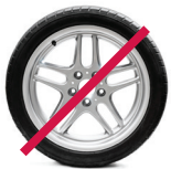
Neumáticos y partes de autos