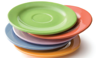
Platos y Espejos