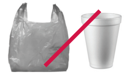
Bolsas de plástico y espuma de poliestireno