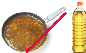
Grasas y aceites