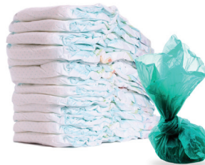
Pañales y excremento de mascotas